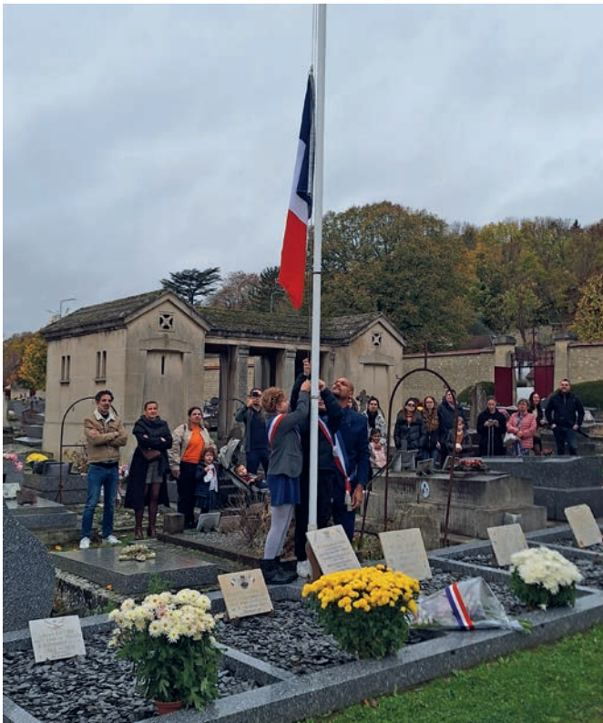
Cérémonie de commémoration de l'Armistice 1918 11 novembre Organisée par la Municipalité