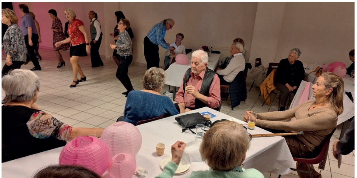
Thé dansant 19 novembre Organisé par le Centre Communal d'Action Sociale