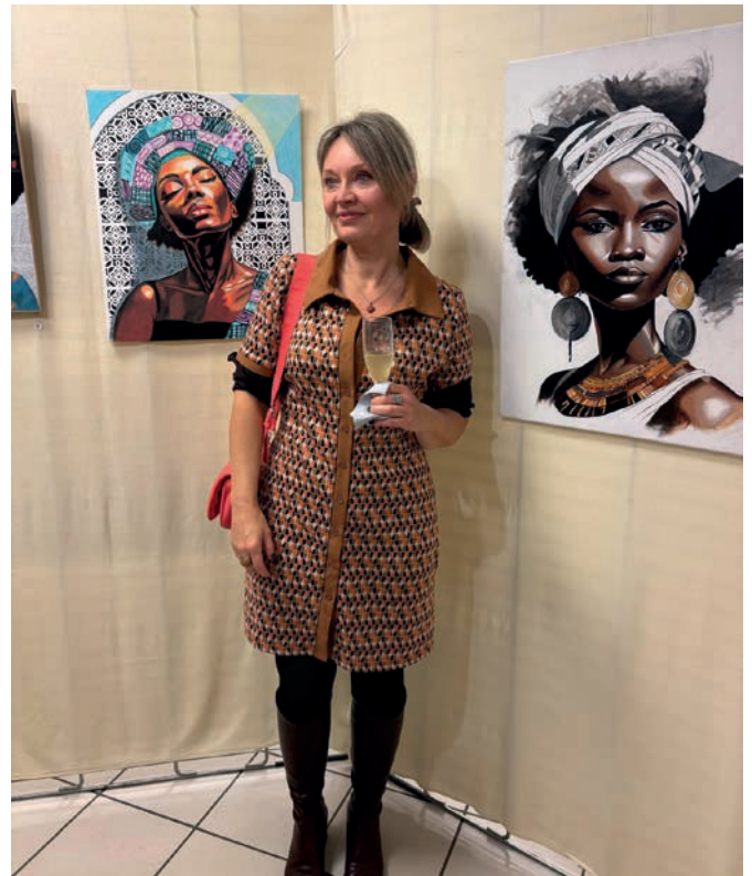
Salon d'art 14, 15, 16 novembre Organisé par Synapse