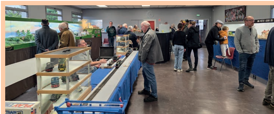
Exposition ferroviaire 16 novembre Organisée par l'Association Ferro- viaire de la Vallée de Seine